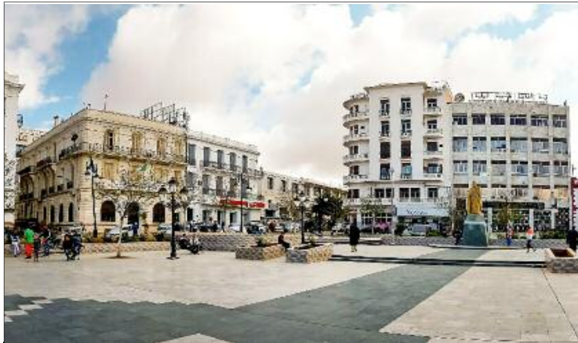
■ La wilaya de Mascara a enregistré, au cours de la période de 2020 à 2024, le financement de 697 micro-entreprises dans le cadre de l'Agence nationale d'appui et de développement de l'entrepreneuriat (Anade).

Par ailleurs, le ministre a fait part de l'inscription de 45 porteurs de projets ayant bénéficié d'une formation au niveau du Centre de développement de l'entrepreneuriat de l'université «Mustapha Stambouli» de Mascara, en plus de la distribution de 71 cartes à de