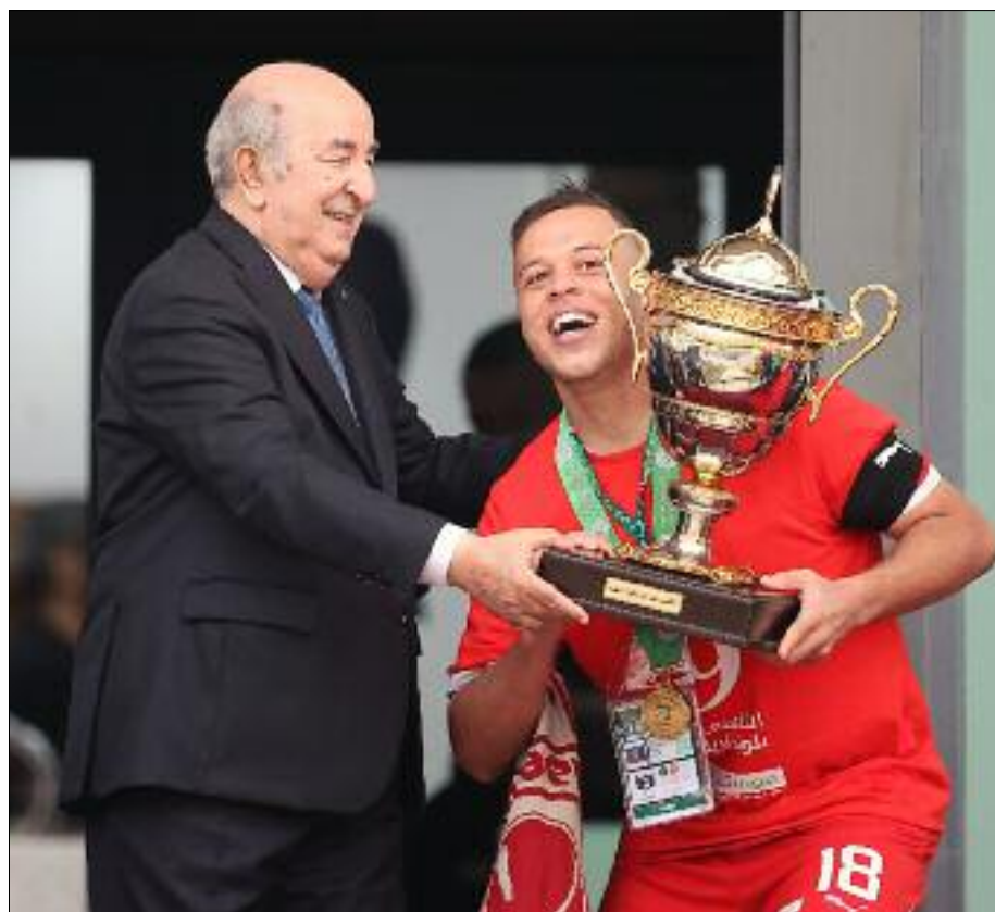
■ Le président de la République remet le trophée au capitaine du CRB.