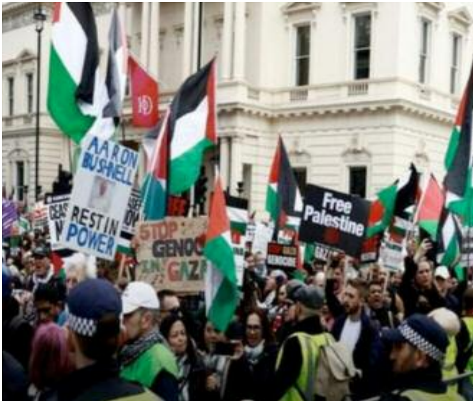
Manifestations à travers le monde pour réclamer la fin du génocide.

«De Londres à Aarhus au Danemark, en passant par Berlin, Uppsala (Suède), Utrecht (Pays-Bas) et Malaga (Espagne), des milliers de sympathisants avec les Ghazaouis et de personnes éprises de paix ont appelé à la fin de l'agression sioniste et à l'introduction sans entraves de l'aide humanitaire dans l'enclave palestinienne», a rapporté l'agence de presse Wafa. Brandissant des drapeaux palestiniens et des pancartes portant des slogans dénonçant les crimes odieux commis par l'occupation sioniste contre le peuple palestinien, les manifestants ont également appelé la communauté internationale à contraindre l'entité sioniste à surseoir à sa machine meurtrière et à respecter les résolutions onusiennes. Ils ont, en outre, appelé leurs gouvernements respectifs à «arrêter la poli-