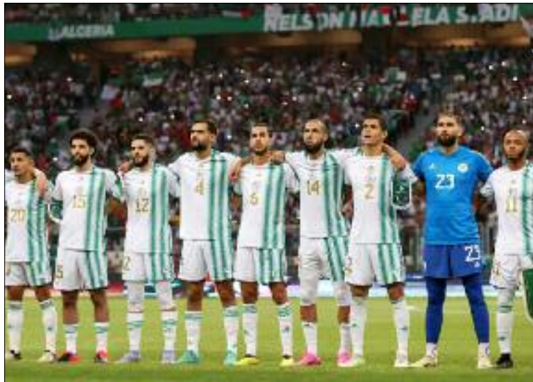
■ Les joueurs de la sélection fixés sur leurs adversaires.

Le 21 juin 2024, à l'issue de son Comité exécutif, qu'a présidé