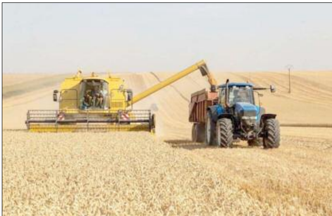
«Ce projet sera le plus grand investissement italien dans un projet agricole de haute technicité au Sud de la Méditerranée».

Intervenant lors d'une conférence de presse animée avec le ministre italien de l'Agriculture, de la Souveraineté alimentaire et des Forêts, Francesco Lollobrigida, en marge de la cérémonie de signature d'un accord-cadre entre son département ministériel et la société italienne Bonifiche Ferraresi (BF) pour la mise en place de ce projet, Youcef Cherfa a affirmé que d'autres projets suivront pour atteindre l'objectif de mise en valeur de 500.000 hectares dans le Sud du pays à l'horizon 2027, fixé par le président de la République, Abdelmadjid Tebboune, au titre du plan national de développement des cultures stratégiques.