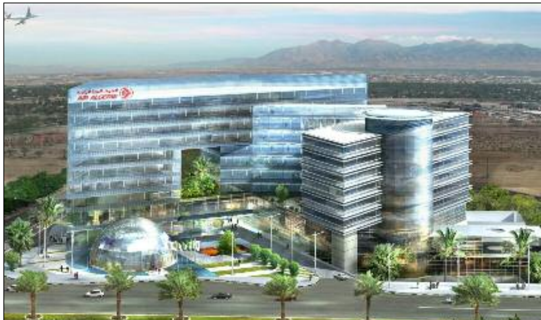
«L'inauguration du siège social d'Air Algérie, en pleine célébration du 62 ème anniversaire de l'Indépendance et de la fête de la Jeunesse, renforce la détermination du staff de la compagnie nationale à aller de l'avant...» (Photo : D.R)

«L'inauguration, aujourd'hui du nouveau siège social, un chef-