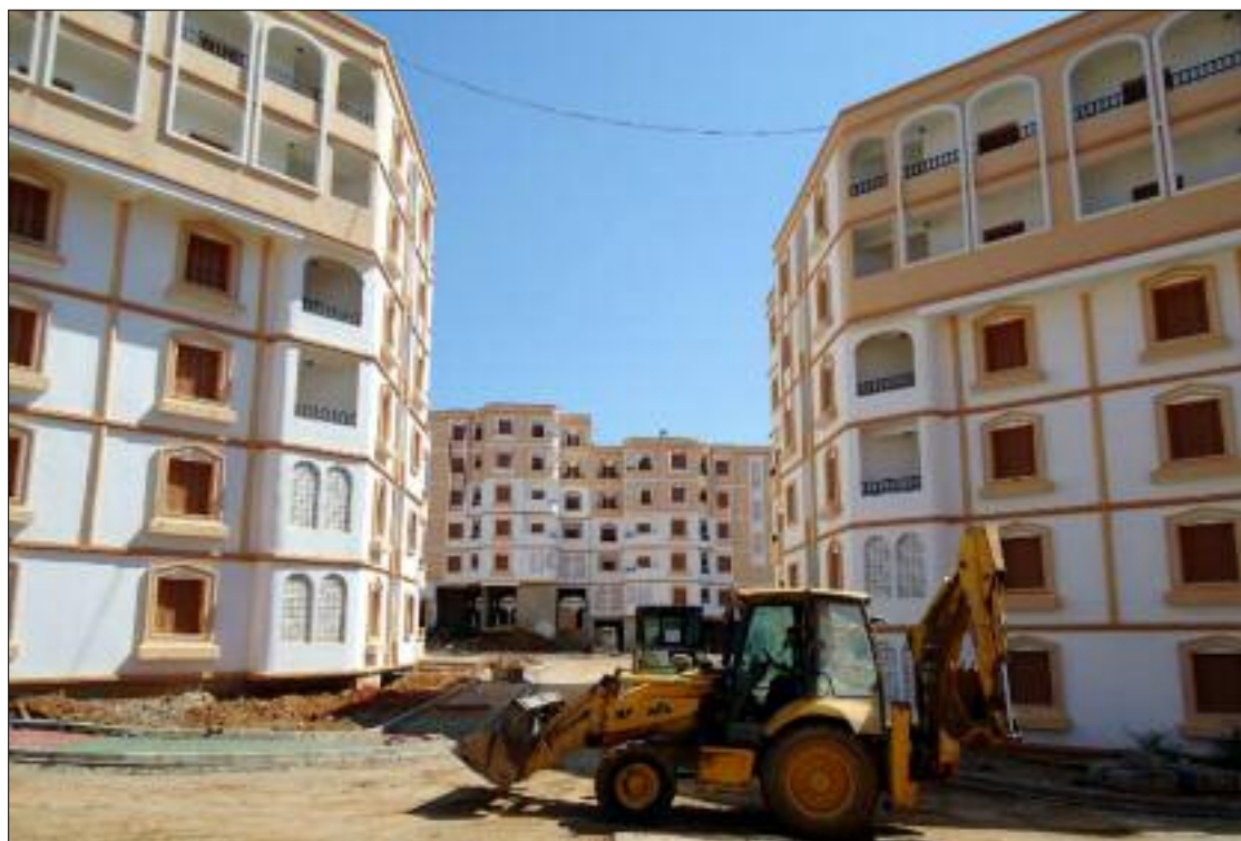
■ L'année 2024 est considérée comme charnière pour le secteur, en raison de la détermination affichée pour concrétiser un programme ambitieux de 460.000 logements à réaliser, en sus de plus de 150.000 aides au logement rural.

Ces résultats ont été obtenus malgré les effets de la pandémie de Covid-19 en 2020 sur le secteur qui a su s'adapter et développer une stratégie pour assurer la